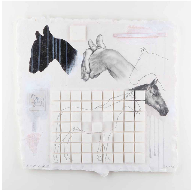
ZOO XINÈS (CAVALL) 2012 DIBUIX I TÈCNICA MIXTA SOBRE PAPER FET A MÀ 40 X 42 CM (APROX.)